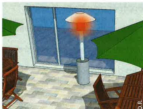
Un parasol chauffant, ou tout autre dispositif de chauffage à proximité de la baie vitrée.