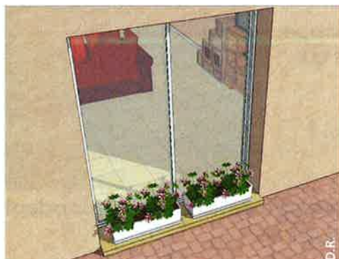
Une jardinière contre la baie vitrée, côté extérieur ou intérieur. Ou tout autre élément d'occlusion.