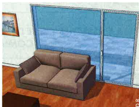
Un canapé (ou tout autre mobilier) plaqué contre la baie vitrée.

Voici des exemples de situations où le risque de casse thermique du vitrage est présent, et qu'il convient donc d'éviter :