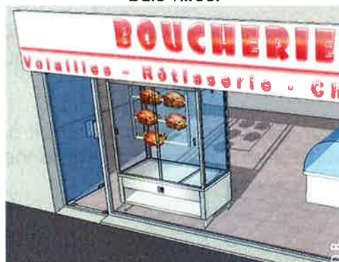
Un four, une rôtissoire, ou tout autre dispositif émettant une forte source de chaleur, à proximité de la baie vitrée.