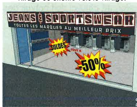
Des stickers de couleur foncée et contrastée sur les vitrages.