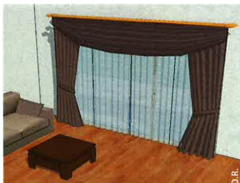
Un rideau foncé et opaque